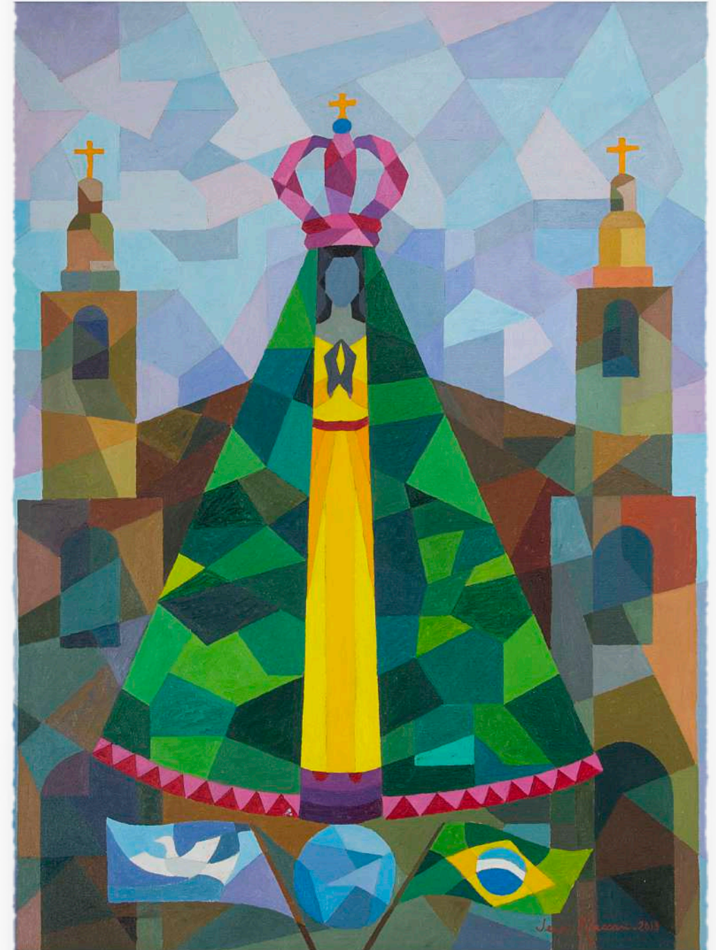
'Aparecida - Mãe do Brasil' de Jerci Maccari